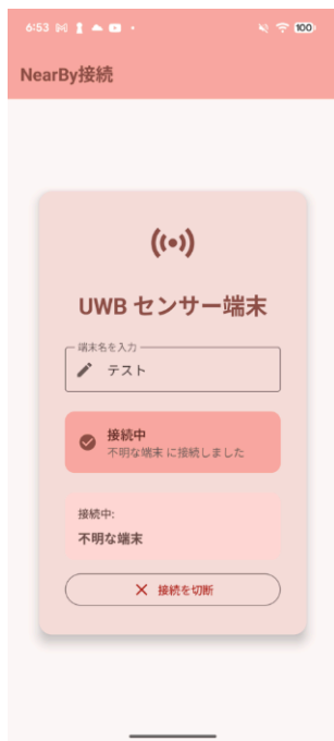
図 3 設定画面のスクリーンショット

ために、アンテナ側の設定項目をモバイル端末の GUI を用いて簡潔に登録できるようにする。なぜならば、アンテナの設定をするときに PC などを利用して設定を書き込む必要がなくなり、専門知識がなくても直感的に操作できるシステムを実現できるためである。これにより、アンテナ側ではアンテナ名の設定とタブレットとのペアリングを行うのみで、その他の設定はタブレット側で一括して行える構成とする (図 3)。複数のアンテナを現地で設置する際にも、各アンテナの設定を設定画面から一元管理できるため、運用負担を軽減できる。