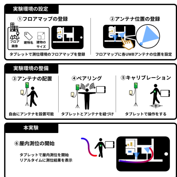
図6 システム動作フローの概要図