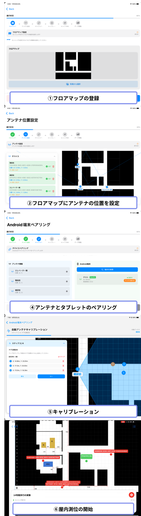
図 4 iPad を用いたシステム統合管理

システム全体を統合管理するために、iPad を用いたポータブル構成を実現する。なぜならば、現地でのフロアマップの登録、アンテナ配置の可視化、測位データのリアルタイム表示などを一元的に管理でき、操作性と携帯性に優れているためである。iPad は Wi-Fi および Bluetooth 通信機能を備えており、スマートフォンと容易に接続できる。また、タッチパネルを備えているため、直感的な操作が可能である。さらに、バッテリー駆動であるため、インフラ環境のない場所でも動作可能である。また、MacOS と iPad のクロスプラットフォーム開発環境である SwiftUI を用いて、iPad と Mac の両方で動作するアプリケーションの開発を行う。これにより、研究者は携帯性が高い iPad で現地での設置・運用を行い、Mac で詳細なデータ解析や設定変更を行える (図 4)。