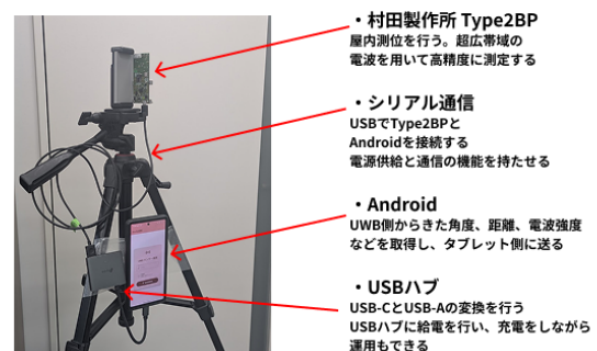
図 2 UWB アンテナに接続されたスマートフォン

スマートフォンを利用した設置の複雑さと運用における機動性の向上をするために、各 UWB アンテナにスマートフォンを接続し、Wi-Fi Direct および BLE による無線通信を実現する。なぜならば、スマートフォンは無線通信機能と内蔵電源を備えており、外部のネットワークや電源に依存しないためである。これにより、壁などで遮られた環境でも自由にアンテナを配置できるようにする。表 1 にスマートフォン、ESP32、RaspberryPi の各デバイスの評価指標比較を示す。すべてのデバイスにおいて Wi-Fi および Bluetooth 通信が可能であるが、スマートフォンは内蔵タッチパネルや内蔵電源を備えており、操作性や携帯性に優れている。また、USB ハブとモバイルバッテリーを組み合わせ、スマートフォンへの給電が可能となり、長時間の運用にも対応できる。スマートフォンは他のデバイスに比べて価格が高いが、無線接続、操作性、内蔵電源、ソフト配布の各評価指標において優れている。また、スマートフォンはアプリストアからソフトウェアを配布できるため、ユーザーがソースコードからビルドする必要がなく、導入が容易である。そのため、本研究ではスマートフォンを選定した (図 2)。